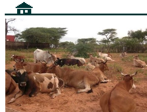
L'élevage : activité traditionnelle des Peulhs

La ferme est située à quelque distance de la route nationale, à 8 km du bourg de Rao, à 20 km de la ville de Saint-Louis. On y accède en empruntant des pistes de sable qui serpentent entre les arbustes de la plaine, en contrebas du fleuve Sénégal.