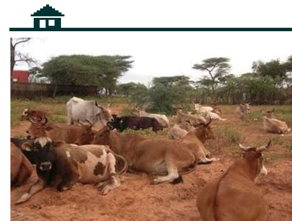
L'élevage : activité traditionnelle des Peulhs

La ferme est située à quelque distance de la route nationale, à 8 km du bourg de Rao, à 20 km de la ville de Saint-Louis. On y accède en empruntant des pistes de sable qui serpentent entre les arbustes de la plaine, en contrebas du fleuve Sénégal.